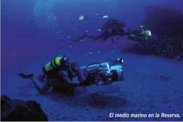
El medio marino en la Reserva.

La isla de Gran Canaria es un edificio volcánico que surgió de las fisuras de la corteza oceánica hace unos 14,5 millones de años, con las primeras erupciones volcánicas submarinas. En la Reserva se encuentran las rocas más antiguas de la isla.