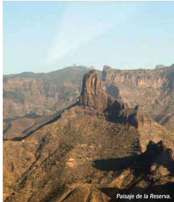
Paisaje de la Reserva.

Fecha de declaración: 29 de junio de 2005