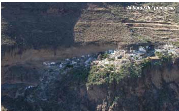
Al borde del precipicio.